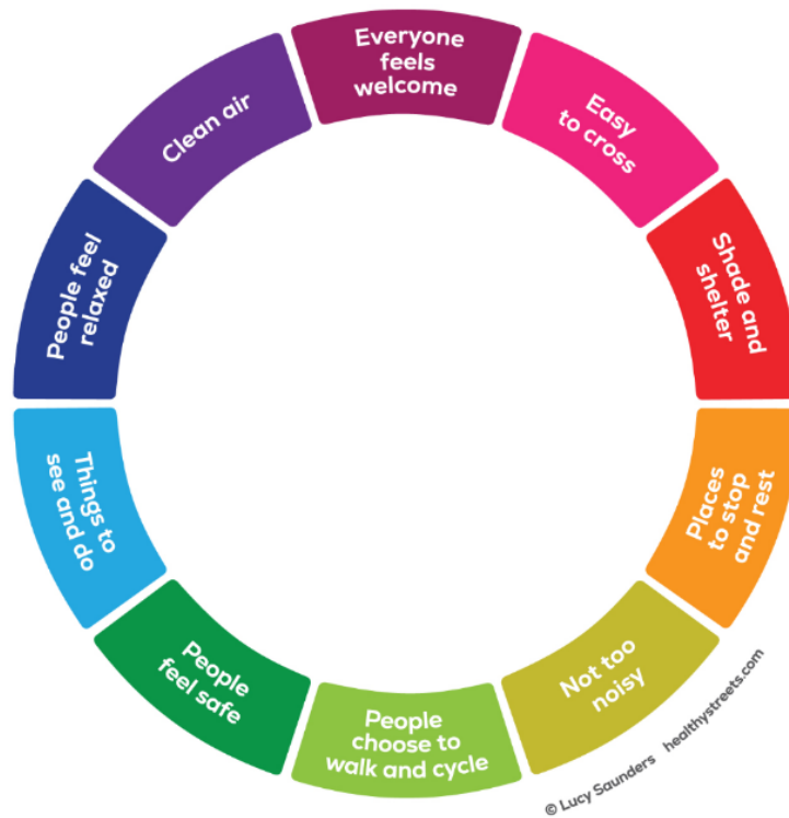
Figiúr 6.3: Deich gcomhartha ar Shráid Sláintiúil

Leis an athrú mór atá anois ar an sochaí tá an iomarca daoine ag brath ar charr agus ní bhíonn dóthain gníomhaíochtaí á gcleachtadh ag an-chuid daoine. Cuireann dearadh fisiceach isteach ar iompar an duine – foirgintí, pobail, sráidbhailte, bailte agus réigiúin. Is fíor go gcuireann ár láithreacha beatha, oibre agus caithimh aimsire isteach ar ár leas idir chorp is anam.